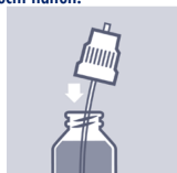
Pumpvorrichtung in die Flasche einführen.