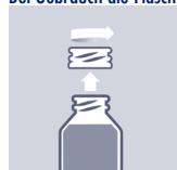
Schraubkappenverschluss aufschrauben, Flasche öffnen.

Bei Gebrauch die Flasche senkrecht halten.