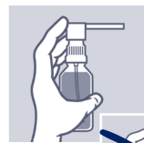
Bei Gebrauch Flasche stets aufrecht halten.