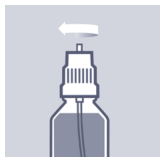
Flasche wieder fest verschließen.