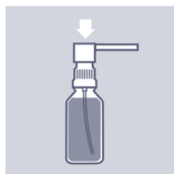
Nun Pumpkopf auf den freiliegenden Teil der Pumpvorrichtung aufsetzen und festdrücken. Vorsicht: Nicht verkanten!